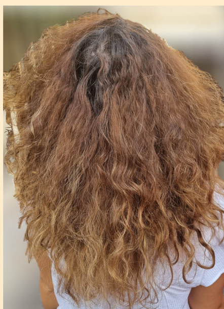
Capello Prima e Dopo un Trattamento Pro Hair Regeneration '7 di Helics

CONSIGLIATO DOPO 7/10 GG DAL TRATTAMENTO LENITIVO O AD OGNI VISITA AL SALONE